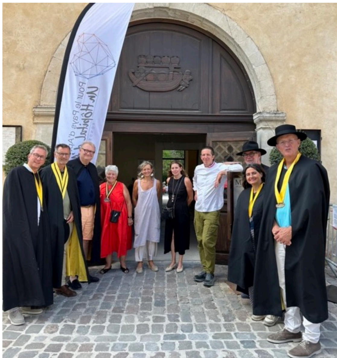
Les organisateurs, le parrain, et les partenaires de la vent aux enchères