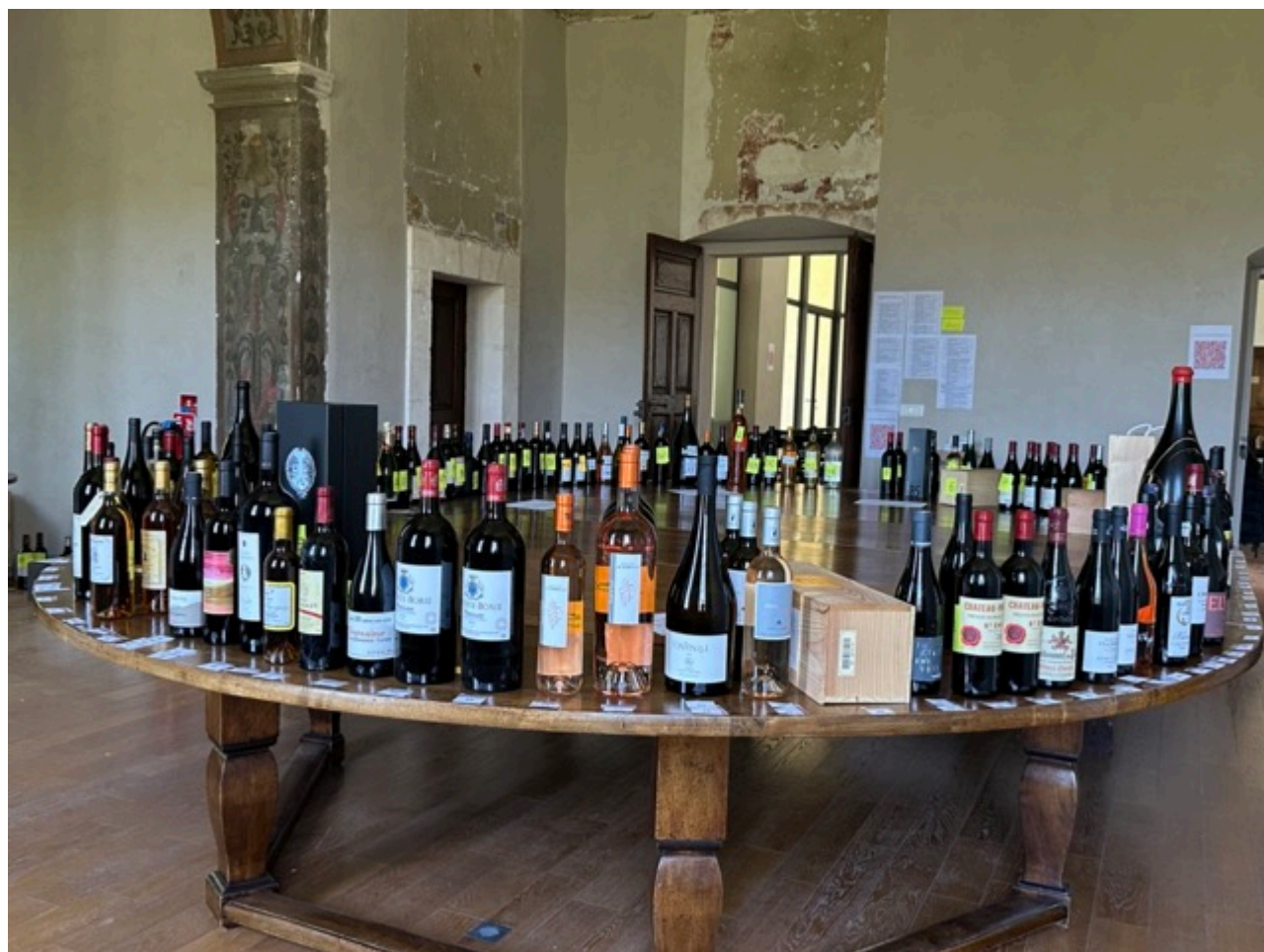
Toutes les bouteilles à la vente

Cet argent sera consacré à l'achat d'un mammographe et au projet de réhabilitation du secteur Grand Âge du centre hospitalier, qui comprend la modernisation, d'une part, de l'Unité de Soins de longue durée (USLD) actuellement localisée dans le bâtiment Combemiane et, d'autre part, de l'EHPAD La Madeleine qui accueille à ce jour 66 résidents.