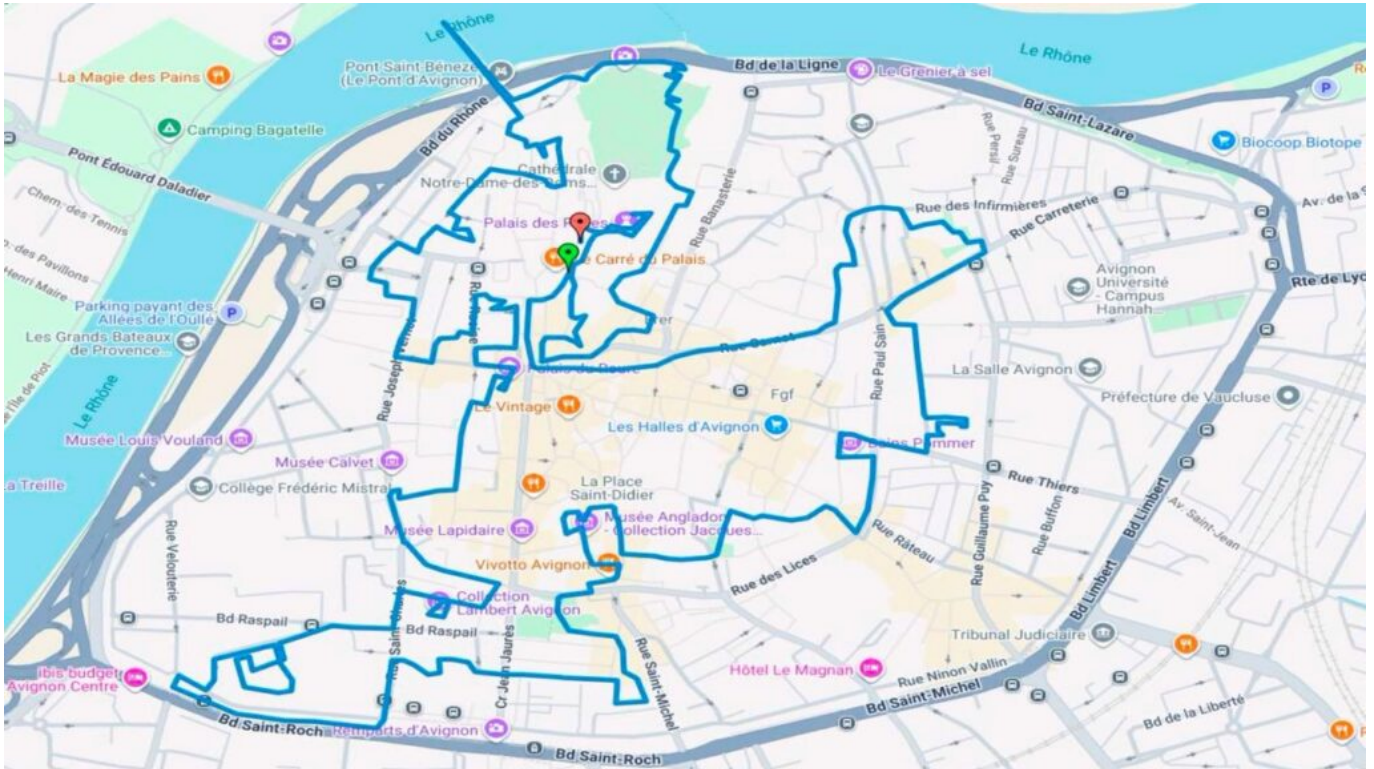
Le parcours de la Nocturne des pages.

concernés et durant les créneaux horaires de la manifestation. »