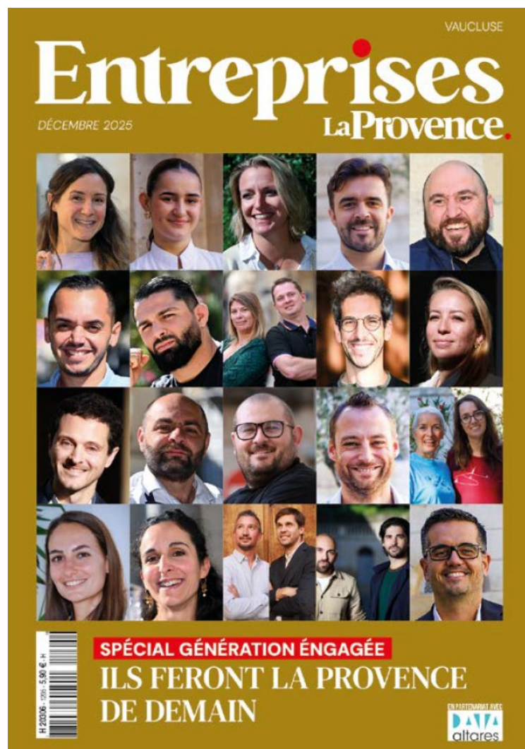
Photo : Les Lauréats vauclusiens de la 'génération engagée' » (Crédit : Jérôme Rey-La Provence)

En plus de la cérémonie des 30e Trophées de l'économie, La Provence a sorti un hors-série spécial de 154 pages.