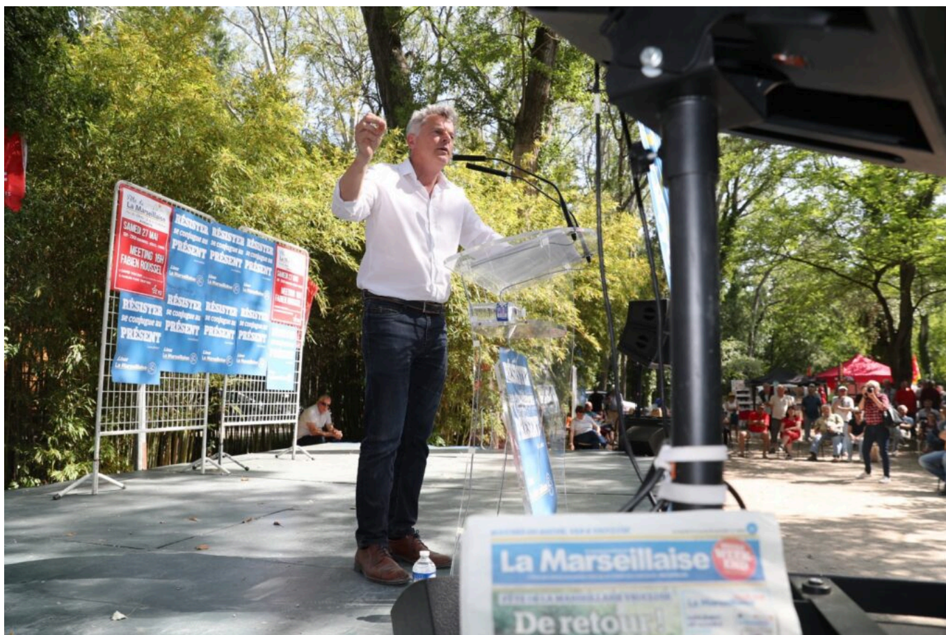
Fabien Roussel, secrétaire national du PCF, durant son intervention lors de la fête de la Marseillaise