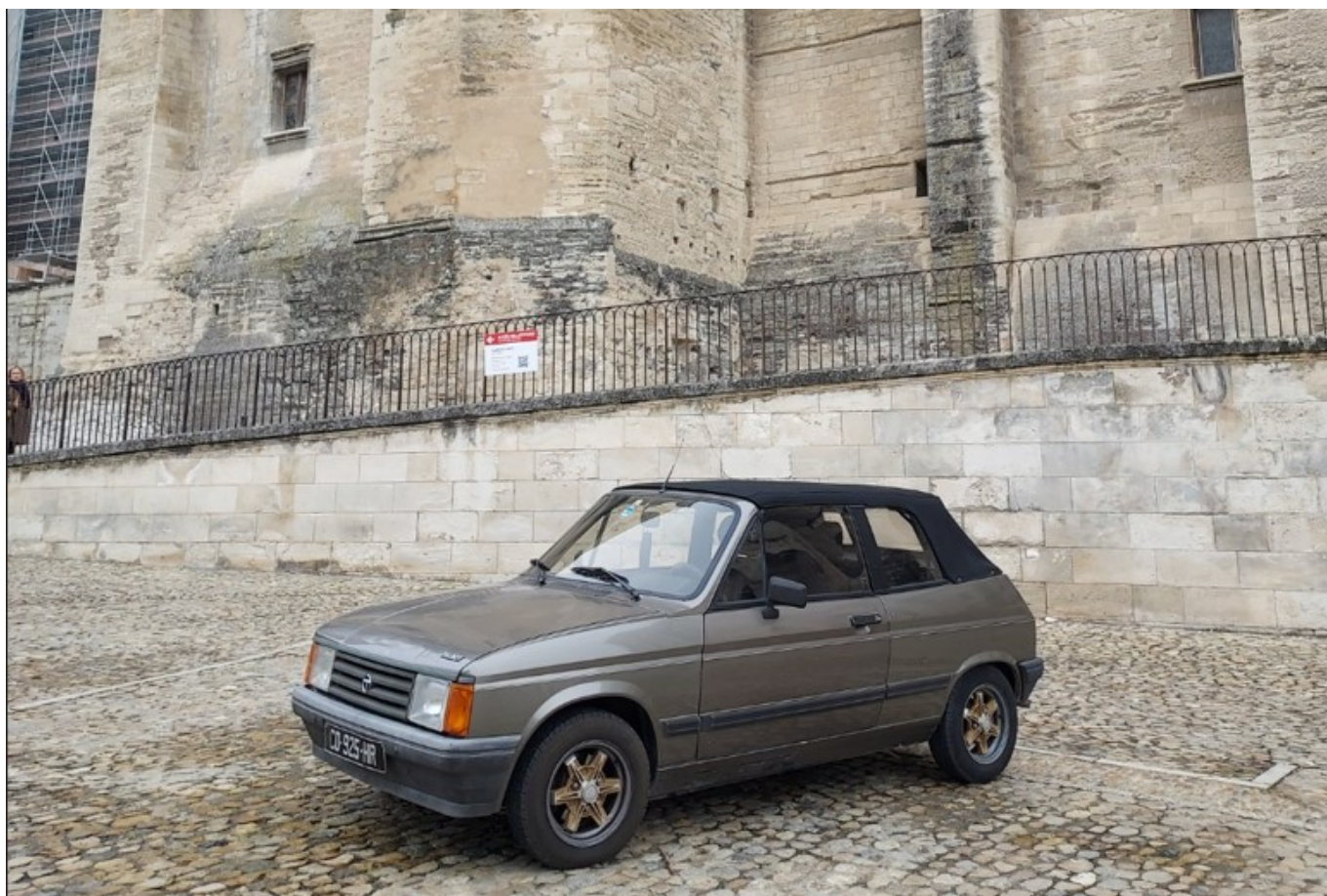
La Samba de Talbot présentée sur l'esplanade du Palais des papes.