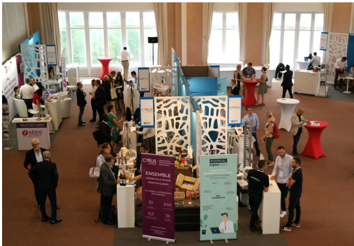
500 participants sur les 2 jours du congrès

Par Vincent Biard pour ResoHebdoEco - www.reso-hebdo-eco.com