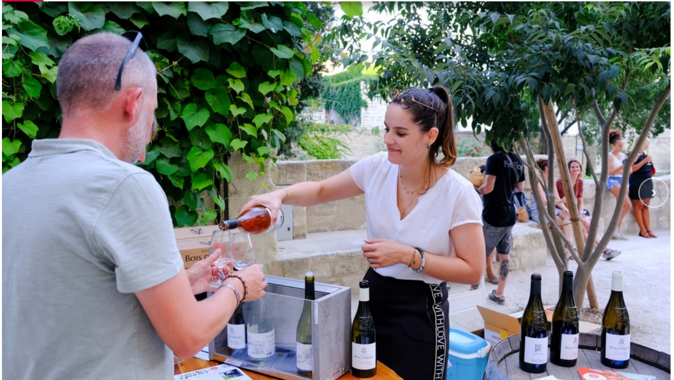
DR Un verre au jardin