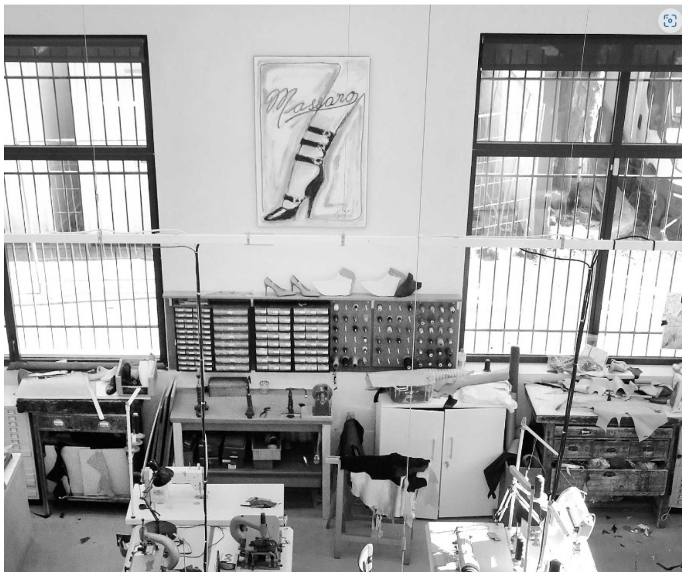
DR Les ateliers Massaro

Musée Angladon ici . Du mardi au dimanche. De 13h à 18h. Toutes les infos pratiques ici et ici . 15€. MH