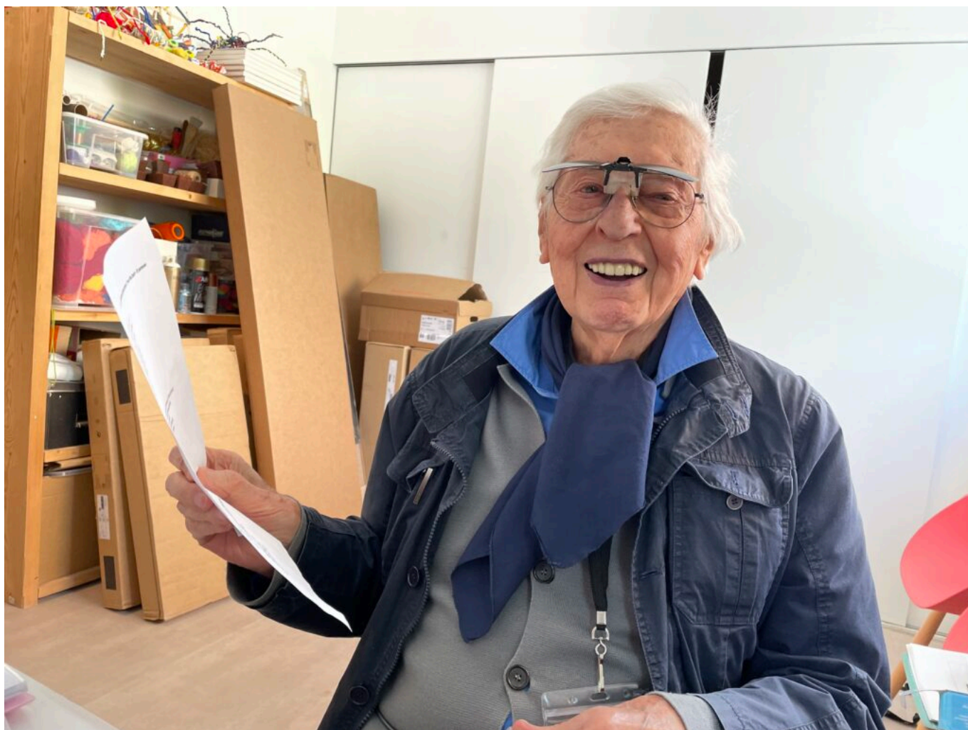
Julio Le Parc, Mai 2023, Villa Datris, Isle-sur-la-Sorgue