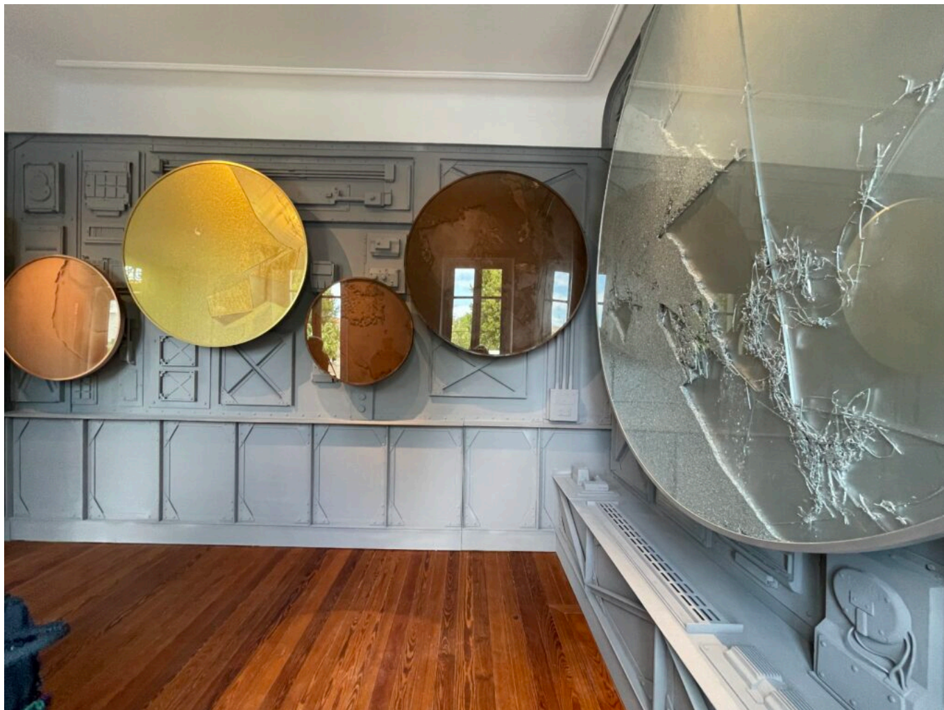
Matières métalliques de Manuel Merida, installation monumentale inédite, mouvement de matériaux dans 5 cercles