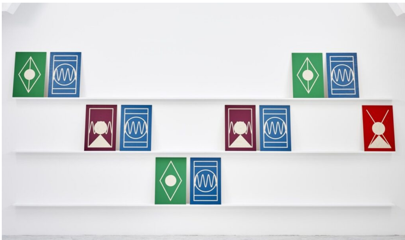
L'œuvre 'Pour Lana'.