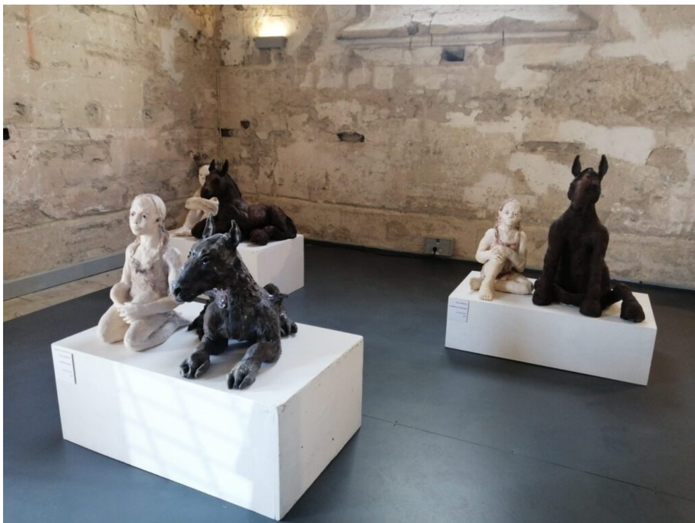
Les œuvres de Ruta Jusionyte.