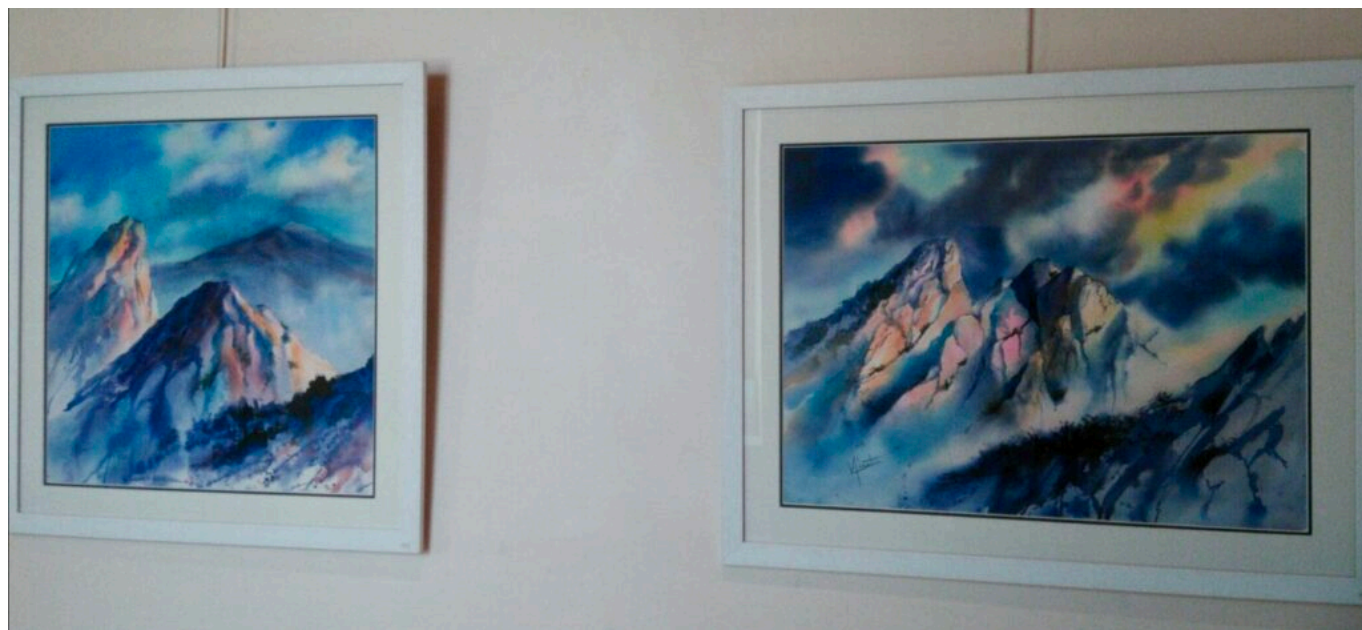
Deux tableaux que vous pouvez admirer à l'exposition. ©Véronique Albert

La mairie de Crillon-le-Brave devra dire au revoir aux peintures de l'artiste avignonnaise Véronique Albert demain. Accessible gratuitement de 10h à 12h30 et de 16h à 19h, cette exposition révèle de nombreux paysages peints à l'aquarelle, une technique de peinture à l'eau. Lorsqu'on entre dans la salle de la mairie, on respire la nature comme si on était au milieu des montagnes grâce aux œuvres affichées aux murs.