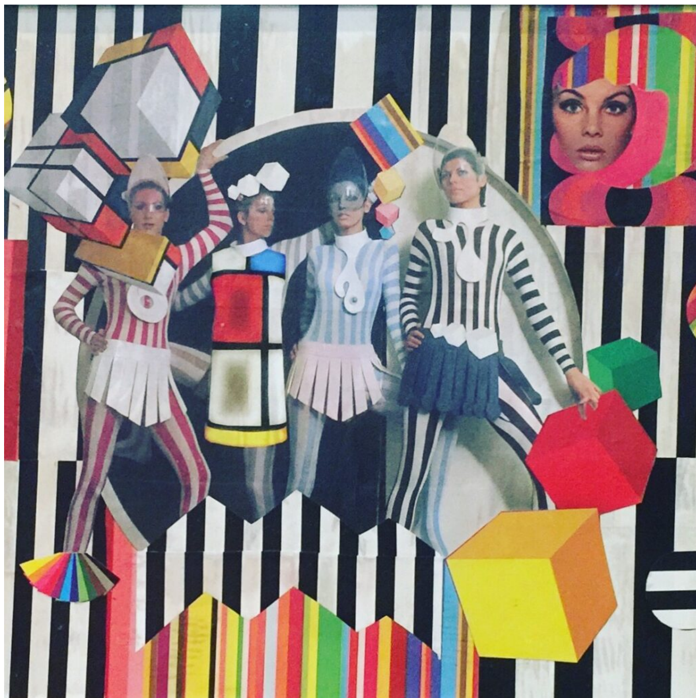
Zebra de Loli Satam DR