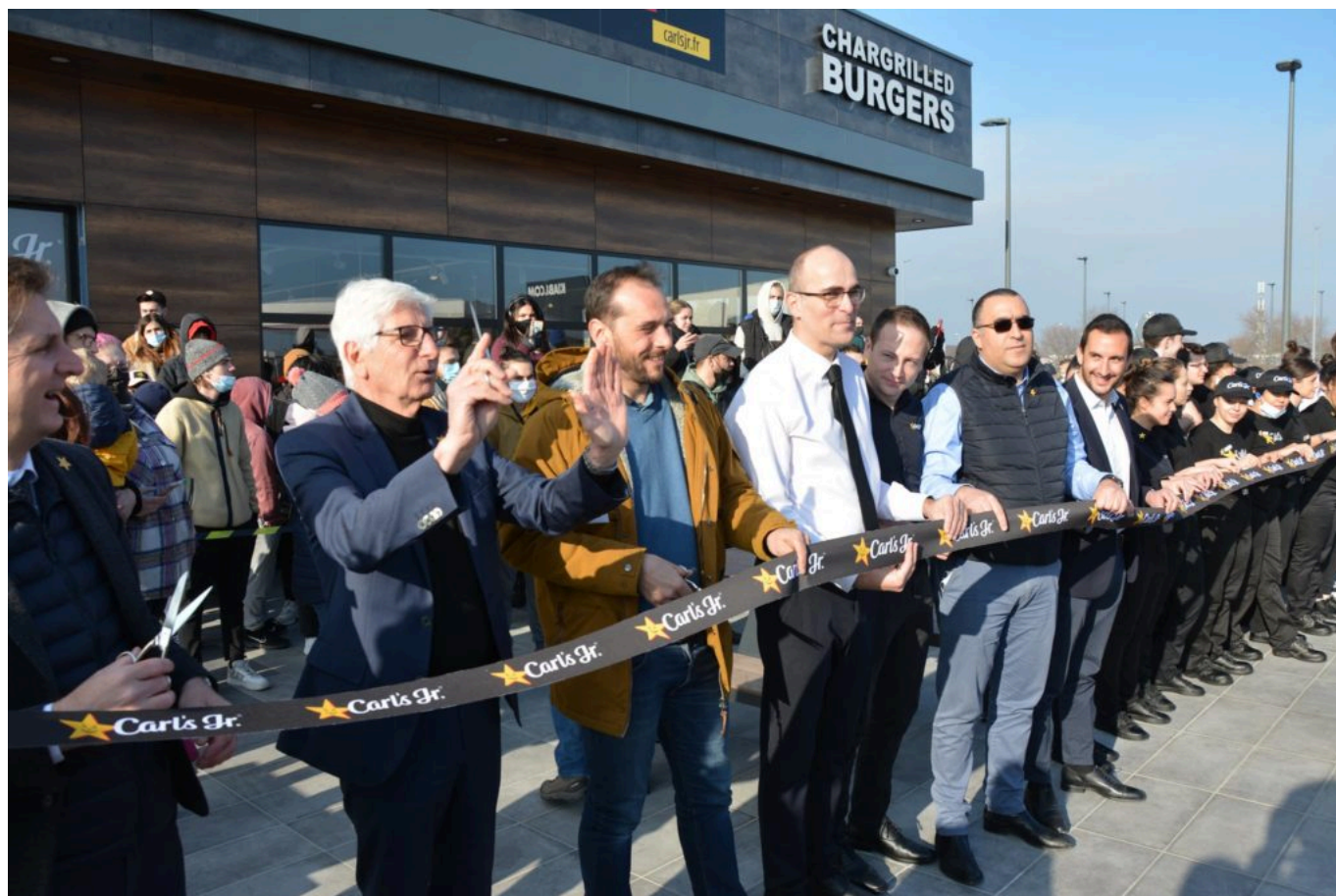
Inauguration du restaurant Carl's Jr Le Pontet.

Entre enseignes internationales de 'fast food', restaurant locaux, établissements étoilés et 'food truck', les burgers envahissent les menus de Vaucluse. Les mastodontes sont solidement ancrés : Burger King, qui a repris Quick en 2015, est notamment installé en Courtine, au Pontet et à Mistral 7, Mc Donald's affiche 17 restaurants en Vaucluse, KFC en possède trois. Sans compter les Tommy's diner et autre Memphis coffee. La frénésie ne risque pas de s'arrêter avec le développement des services de livraison tels que Just eat, Deliveroo ou Uber eats sur Avignon depuis 2018.