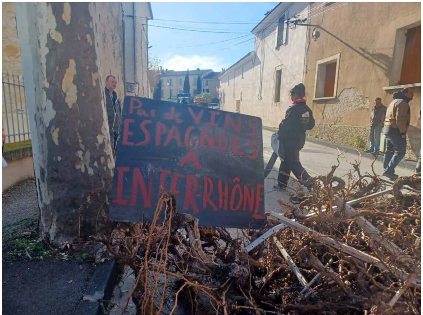
Manifestation à Sablet.

Le 25 novembre dernier, ce sont les viticulteurs qui ont défilé à Narbonne pour afficher leurs doléances face à la concurrence déloyale d'importation de vins produits par nos voisins européens qui, eux, n'ont pas à se plier à des injonctions de normes aussi drastiques que les nôtres. Au début de l'année, on a vu les Jeunes Agriculteurs retourner les panneaux de signalisation à l'entrée des villes et villages pour montrer qu'on marchait sur la tête. Mais personne, dans les hautes sphères, n'a fait attention à ces signaux d'alarme.