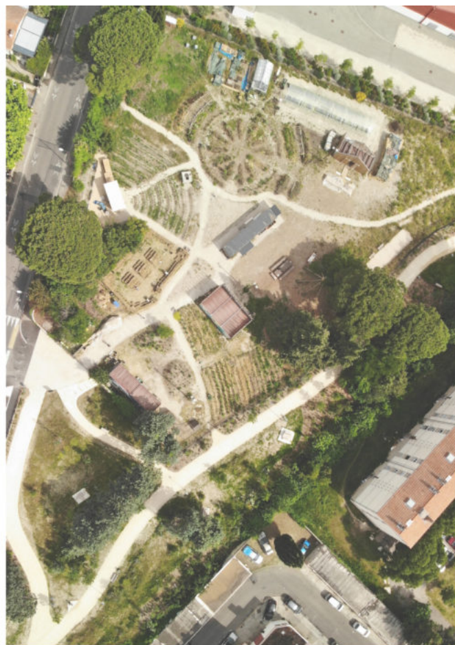
Le site de la ferme urbaine Le Tipi en juin 2021