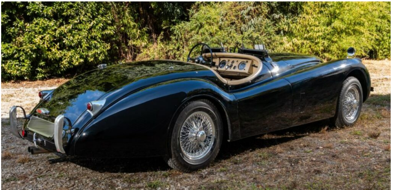
Jaguar XK 120 de 1953

Parmi ces pièces d'exception, une Alfa Romeo 1900 Super Sprint Touring Superleggera de 1954 attire déjà les regards. Carrossée par Touring, rare -à peine 854 exemplaires produits- et éligible au Mille Miglia, elle symbolise la quintessence du style italien : finesse des lignes, intérieur vert amande et histoire jalonnée de concours d'élégance.