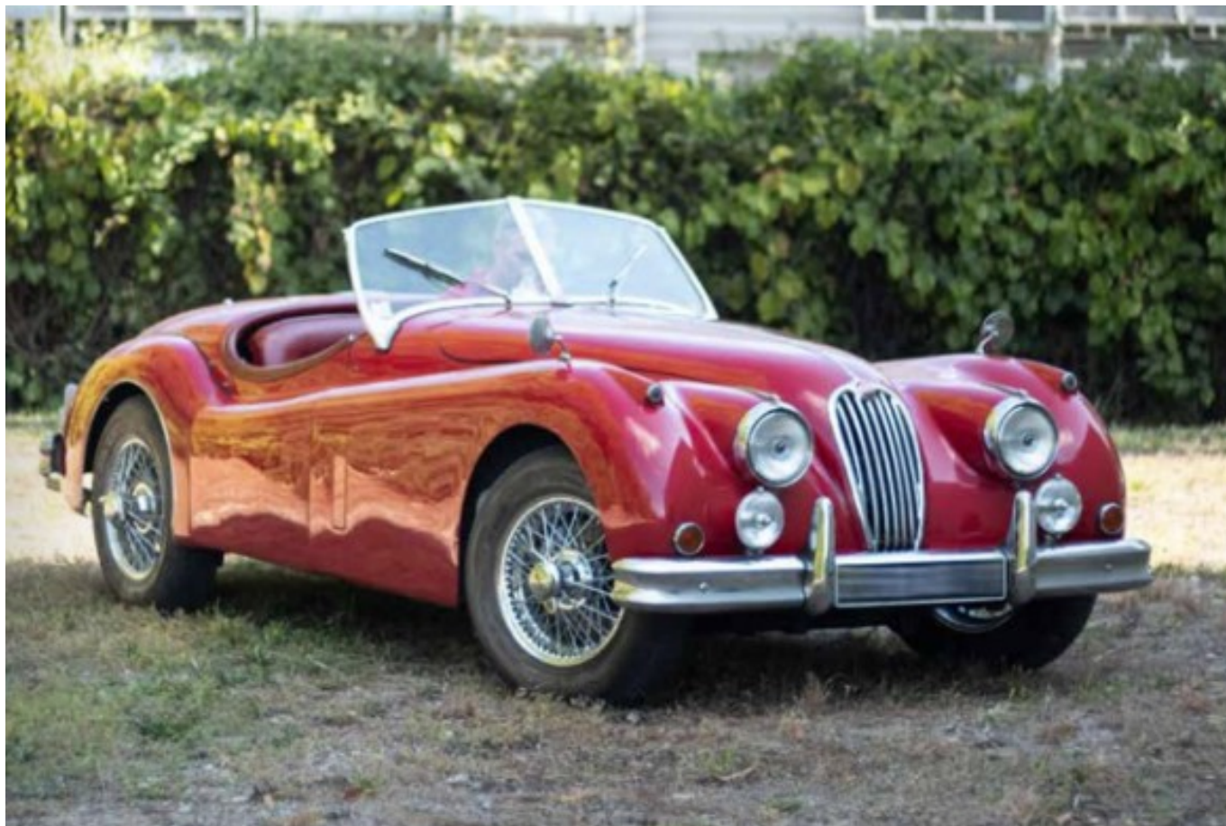
Jaguar XK 140 de 1955

deviendra successivement propriétaire des concessions Mercedes VP et VI de Nîmes et Montpellier. Passionné d'automobiles il a fait l'acquisition de véhicules de collection au fur et à mesure des années et des opportunités qui s'offraient à lui. Acquisitions qui se faisaient auprès de particuliers gardois ou vauclusiens, où lors de ventes publiques. Son amour des belles mécaniques le conduira à édifier un bâtiment pour abriter sa collection. »