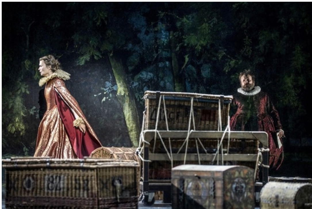
'Le Soulier de satin'