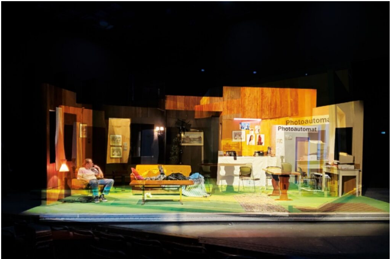
'Le Canard sauvage' d'Henrik Ibsen