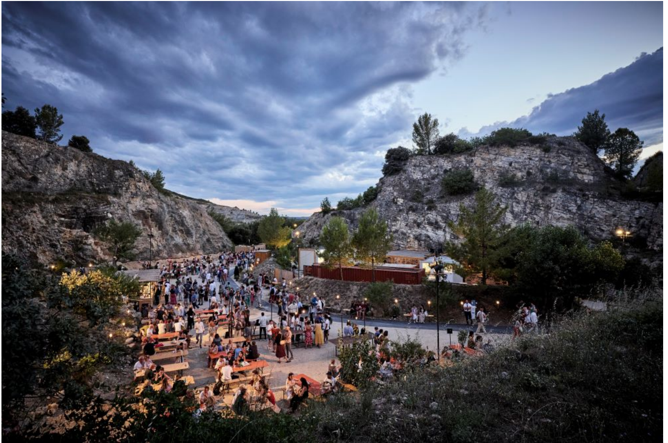
Les Carrières de Boulbon