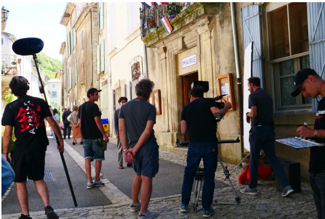
Tournage de L'Or bleu.