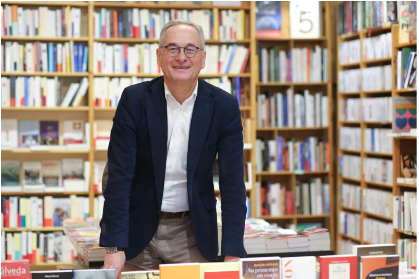
Humbert Mogenet