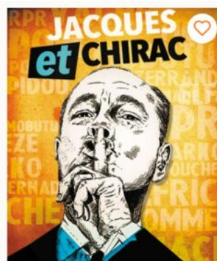
Jacques et Chirac