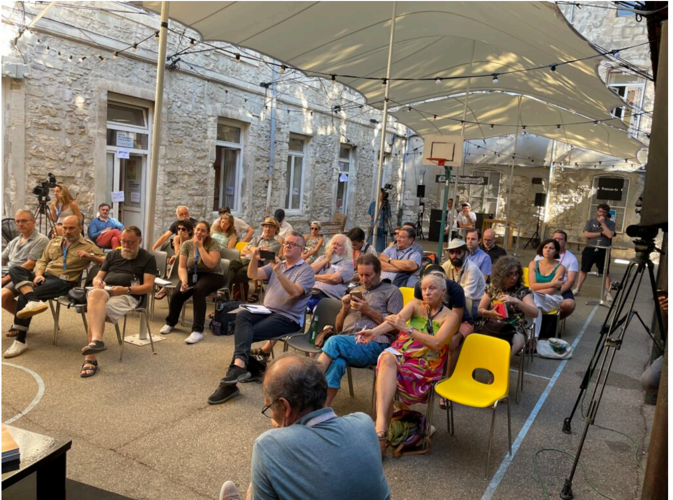
Les journalistes de la conférence de presse