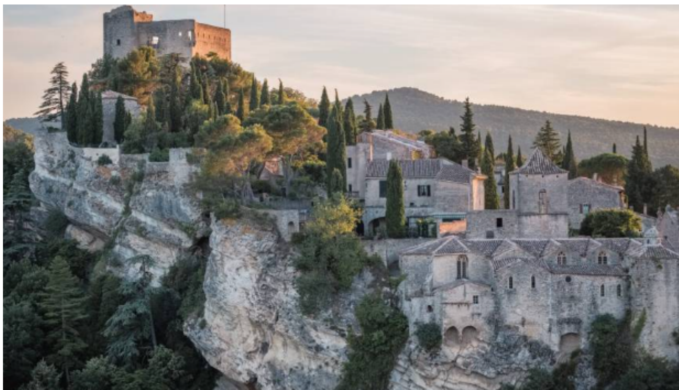
Vaison la Romaine

Venez cuisiner les légumes récoltés au Jardin des partages de Vaison-la-Romaine. Atelier convivial, intergénérationnel, animé par les animatrices du Naturoptère/Université populaire du Ventoux. Repas partagé.