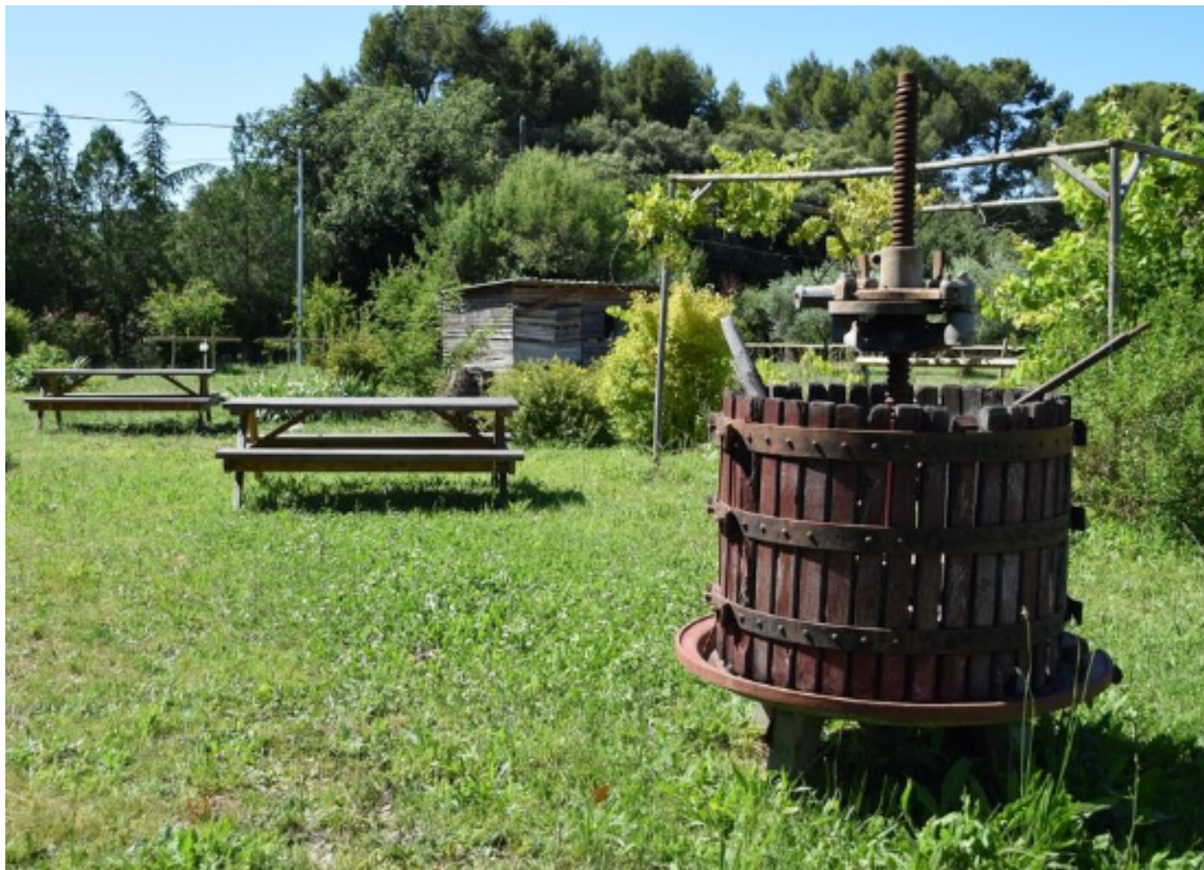
La ferme du Rouret à Mazan

En cette fin de saison automnale, la Ferme du Rouret propose de découvrir les bois qui entourent la propriété à l'occasion d'un spectacle de musique et d'histoires étranges au coucher du soleil. Une expérience assurément inédite.