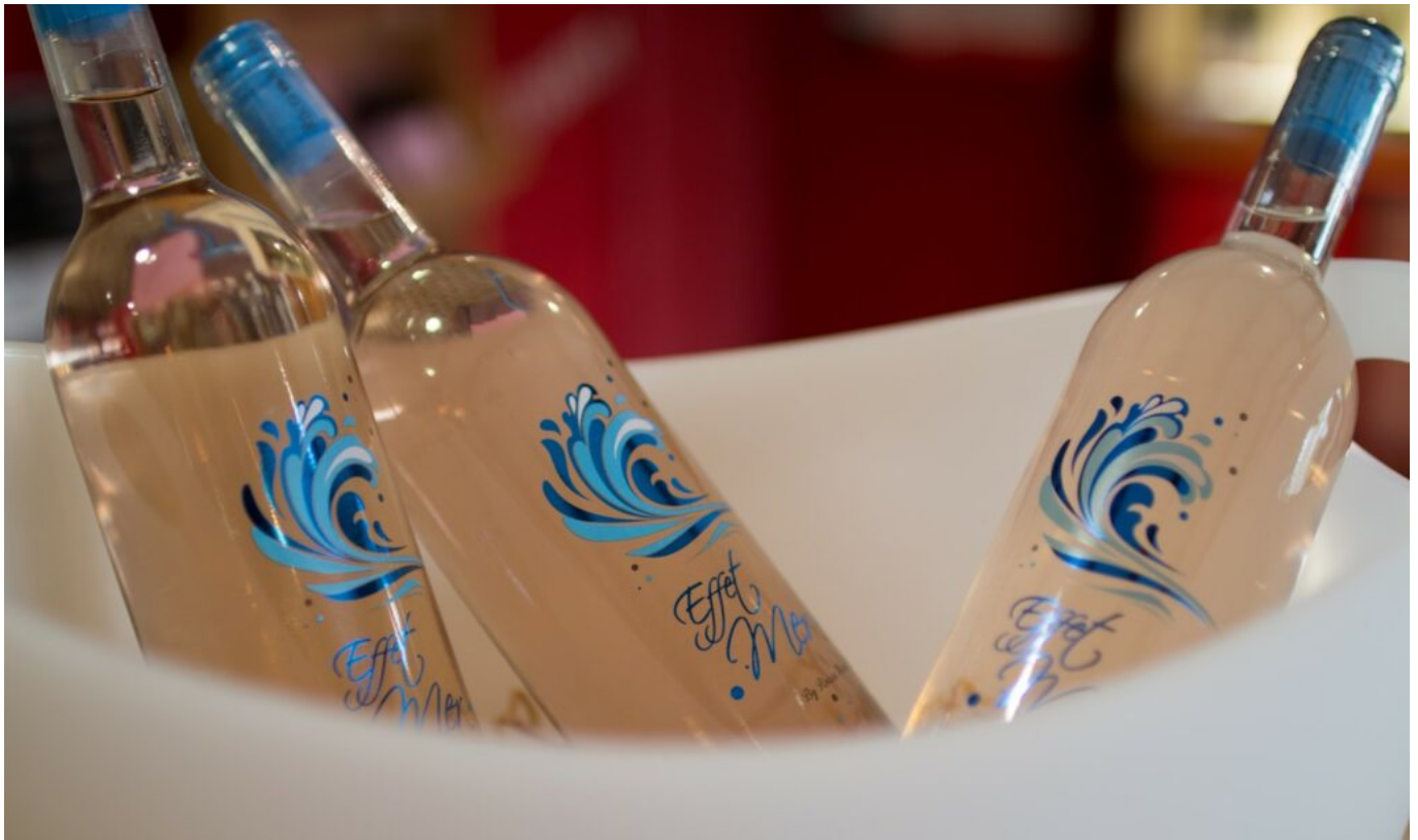
La cuvée 'L'Effet Mer'.

Toutes ces Côtes-du-Rhône seront en vedette le week-end du 14 février, pour la Saint-Valentin , avec en particulier une dégustation à la cave le vendredi soir. En général, plus de 10 000 amoureux se retrouvent dans les rues de Roquemaure pour cette « Fête des Baisers », pour un défilé historique en costumes d'époque, avec chevaux et calèches et au son d'une trentaine d'orgues de barbarie, de limonaires, mais aussi de fifres, galoubets et tambourins.