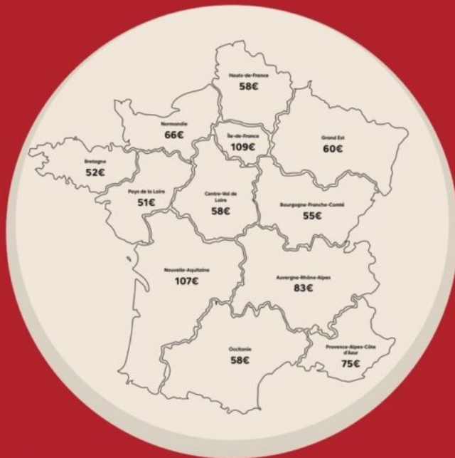
Budget Fête des mères en fonction des régions