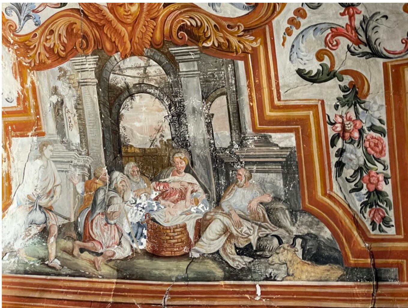
Détail d'une fresque de la chapelle Notre dame la Brune