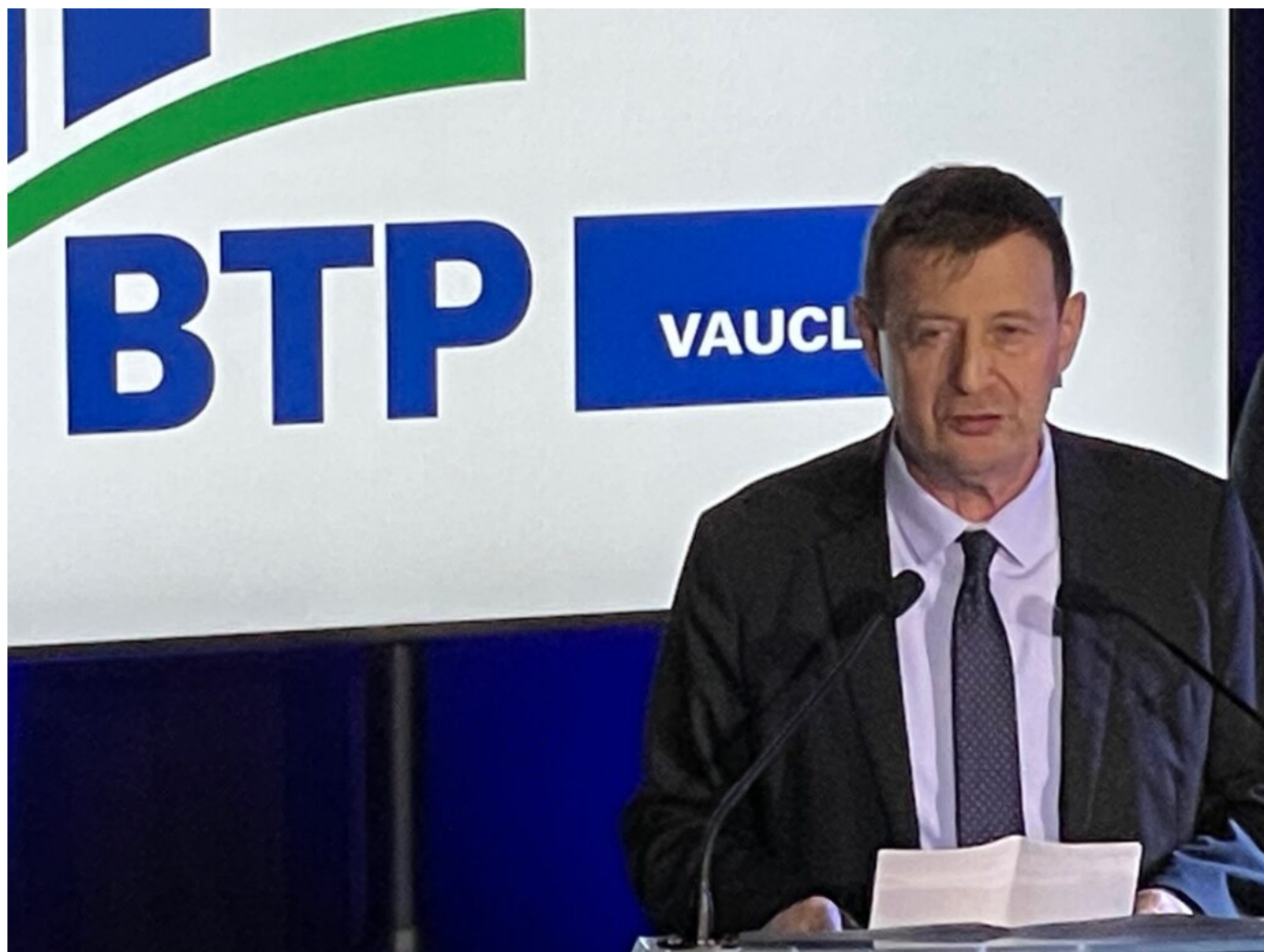
Thierry Suquet

Le préfet de Vaucluse Thierry Suquet a conclu la soirée des vœux du BTP 84, rappelant le poids économique majeur du secteur du bâtiment dans le département : près de 20 000 travailleurs, 10% de l'emploi salarié et environ 6 000 entreprises, majoritairement des TPE/PME (Très petites et moyennes entreprises), profondément ancrées dans le tissu local. Un secteur stratégique, dont la vitalité repose à la fois sur la proximité, l'excellence des savoir-faire et le respect des responsabilités des maîtres d'ouvrage, en particulier sur un point jugé crucial : les délais de paiement, déterminants pour la santé des trésoreries.