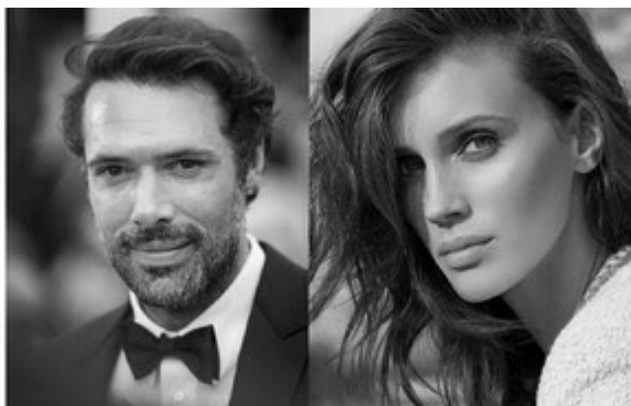
Nicolas Bedos (réalisateur) et Marine Vacth (actrice)

L'avant-première aura lieu le samedi 29 octobre à 20h, quelques jours avant la sortie officielle prévue le 1er novembre. Pour assister à cet évènement, il faut réserver sa place à la caisse ou sur internet .