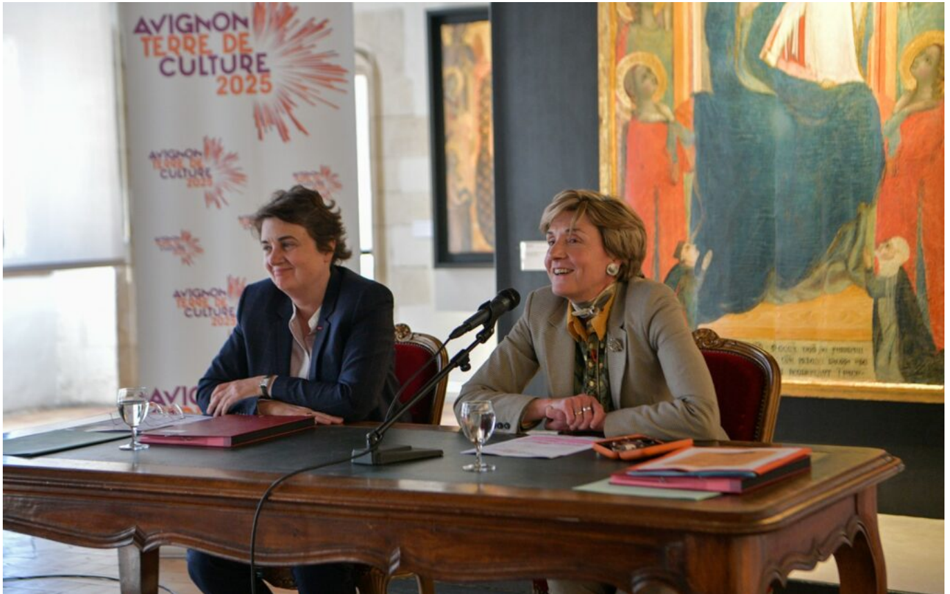
Laurence des Cars, présidente-directrice du musée du Louvre (à gauche), et Cécile Helle, maire d'Avignon.

régionale des affaires culturelles) de Provence-Alpes-Côte d'Azur, pour un montant total de 500 000€. Le site, qui abrite l'une des plus importantes collections de primitifs italiens (période allant du monde Moyen-Âge à la première Renaissance) devrait rouvrir le 2 mai prochain.