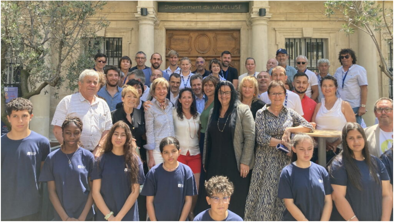
Elus, sportifs et enfants réunis pour le lancement des festivités