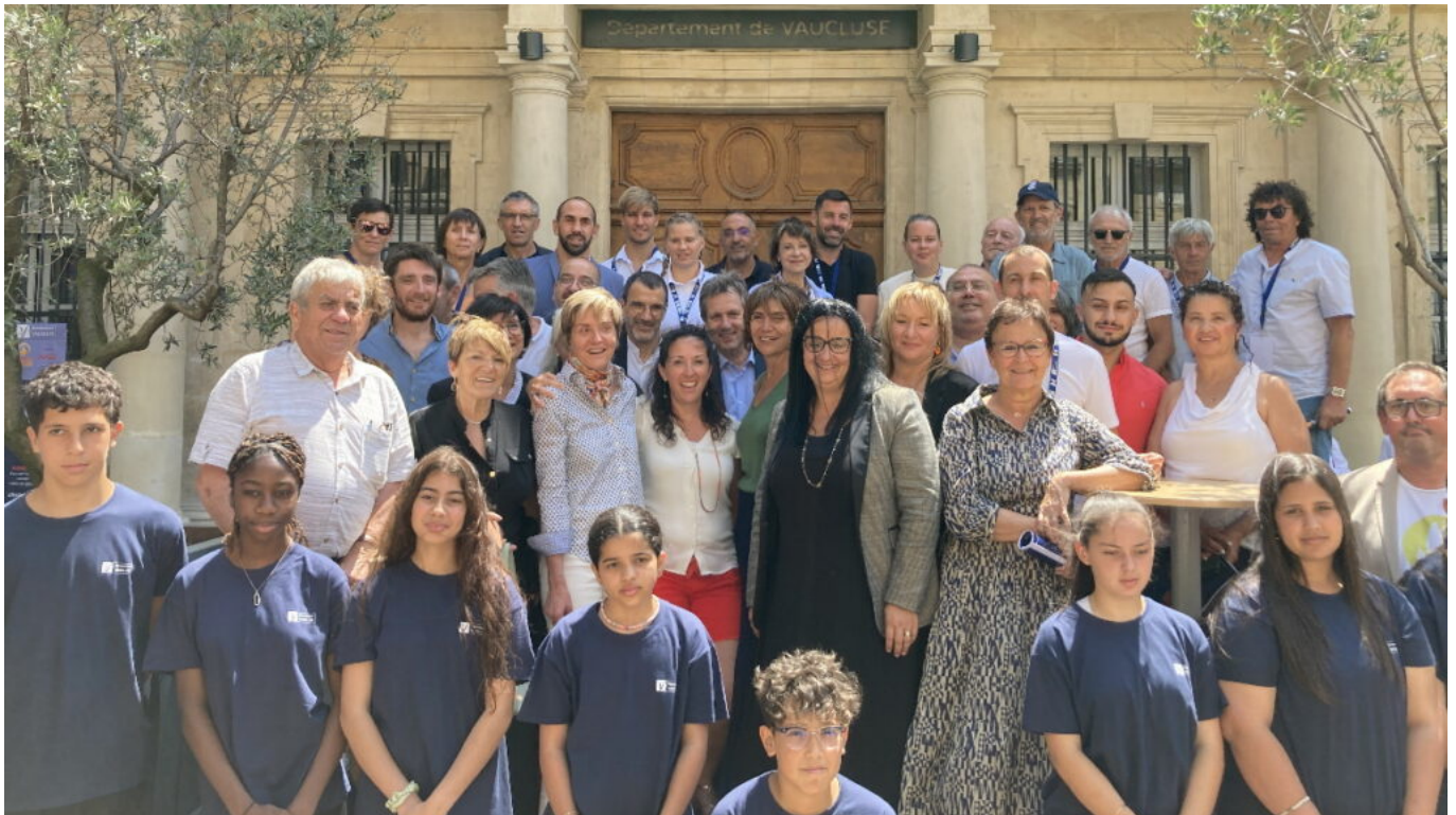
Elus, sportifs et enfants réunis pour le lancement des festivités