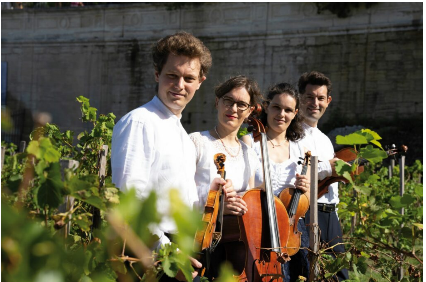
Le quatuor Girard.