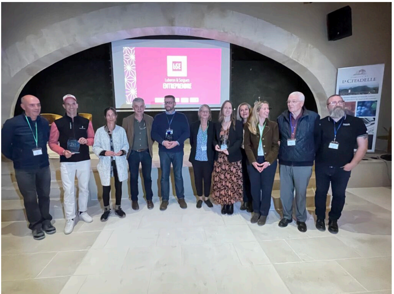
Les lauréats et partenaires

Le jury était composé de la CCPSMV , Communauté de communes Pays des Sorgues et Monts de Vaucluse ; de la CALMV , Communauté d'Agglomération Luberon Monts de Vaucluse ; de la CMAR (Chambre des métiers et de l'artisanat de Provence-Alpes-Côte d'Azur) ; du Réseau Entreprendre ; d' Initiative Terre de Vaucluse ; du Lycée Alphonse Benoît ; du Greta (Groupement d'établissements publics locaux d'enseignements), d'anciens lauréats et d'une journaliste.