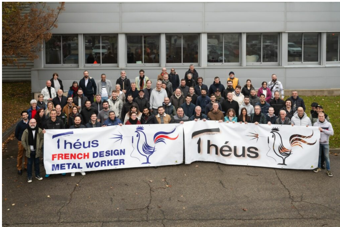
L'équipe de Theus Industrie