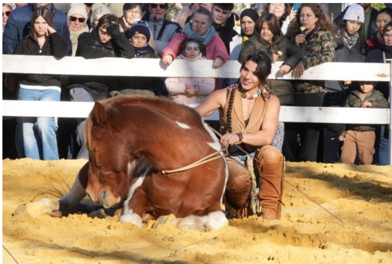
Démonstration de dressage