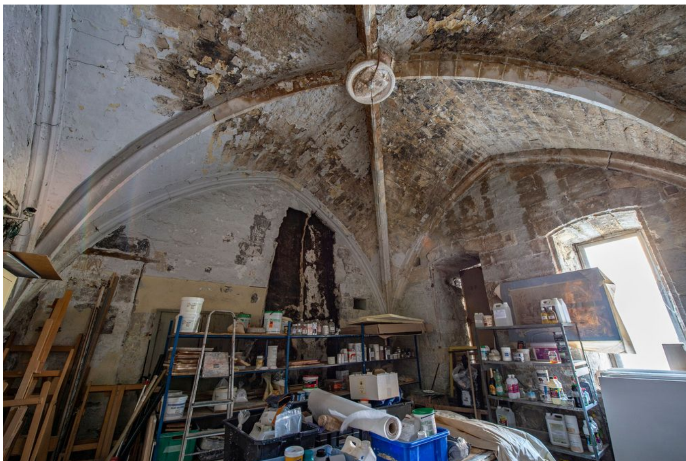
La Maison du Roi René.

Cette volonté de préserver le patrimoine est également portée par la Mission du patrimoine, déployée par la Fondation du patrimoine et portée par Séphane Bern. La Mission patrimoine a sélectionné 100 projets départementaux en 2022. Chaque projet va recevoir une dotation, dont la Maison du Roi René à Avignon qui présente aujourd'hui une stabilité fragile qui pourrait mettre en danger l'édifice et ses bénéficiaires. Les travaux devraient s'achever fin 2024 ou début 2025.