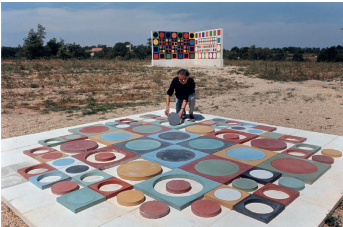
Victor Vasarely réalise une composition murale en carreaux de ciment coloré chez l'éditeur William Wise à Lacoste, 1964