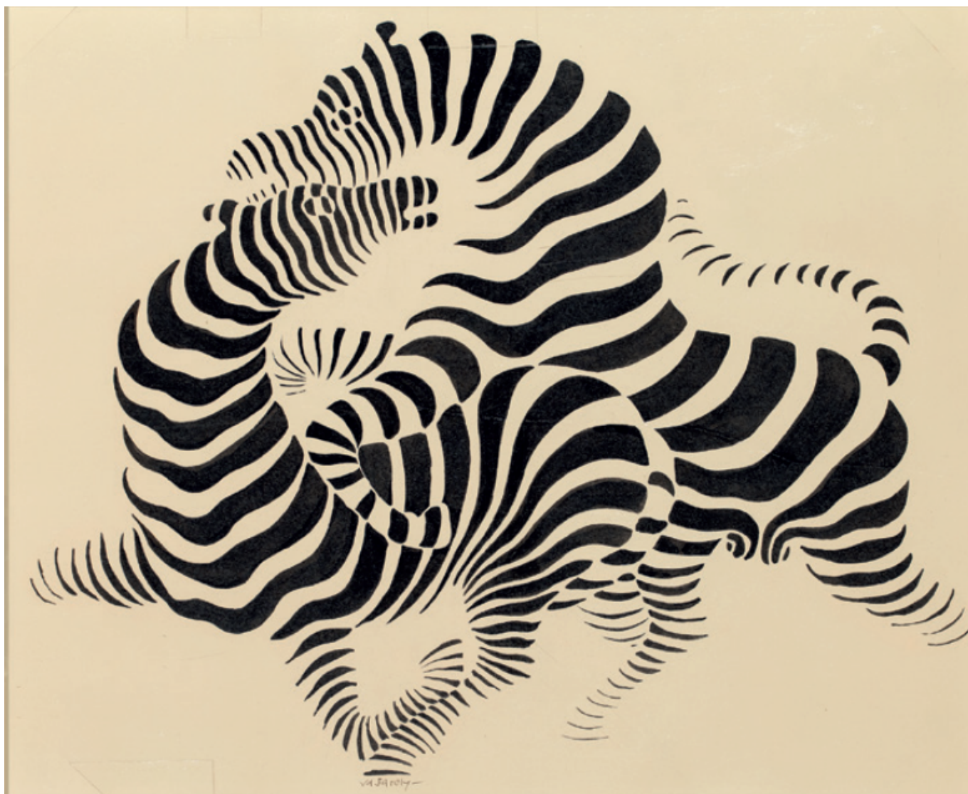
Zèbres A, 1938