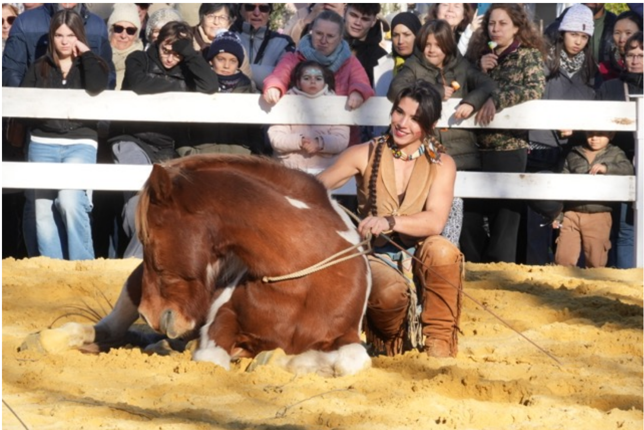
Démonstration de dressage