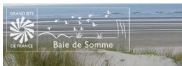
variante blanc sur fond transparent