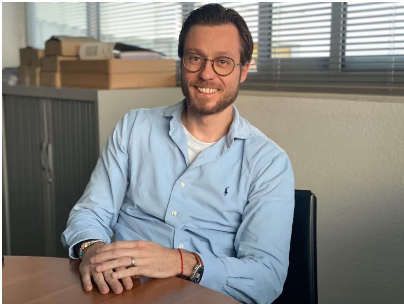
Mathieu Dupressoire Copyright MMH

Pendant le cursus, des chargés d'apprentissage se rendent physiquement en entreprise pour s'assurer de l'adéquation entre les missions confiées, le référentiel de formation et la réalité du terrain. Ils veillent aussi à l'intégration du jeune dans les équipes. Cette triangulation école-entreprise-étudiant constitue le cœur du 'contrat pédagogique' de l'IFC.