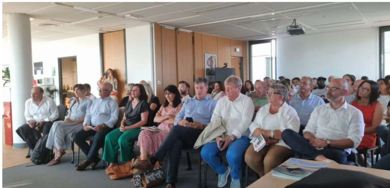
Une soixantaine de personnes ont participé à la première AG du GEIQ Auto Camion 2 Roues Sud.