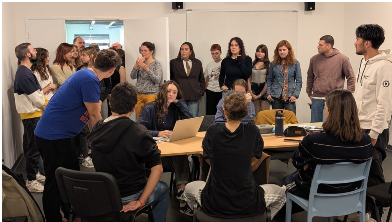
Les étudiants en Bachelor Acting & Théâtre ont fait leur rentrée ce lundi 13 octobre.

Le campus avignonnais comptabilise désormais trois formations : Bachelor Acting & Théâtre, Bachelor Son & Musique, et Bachelor Cinéma & Audiovisuel.