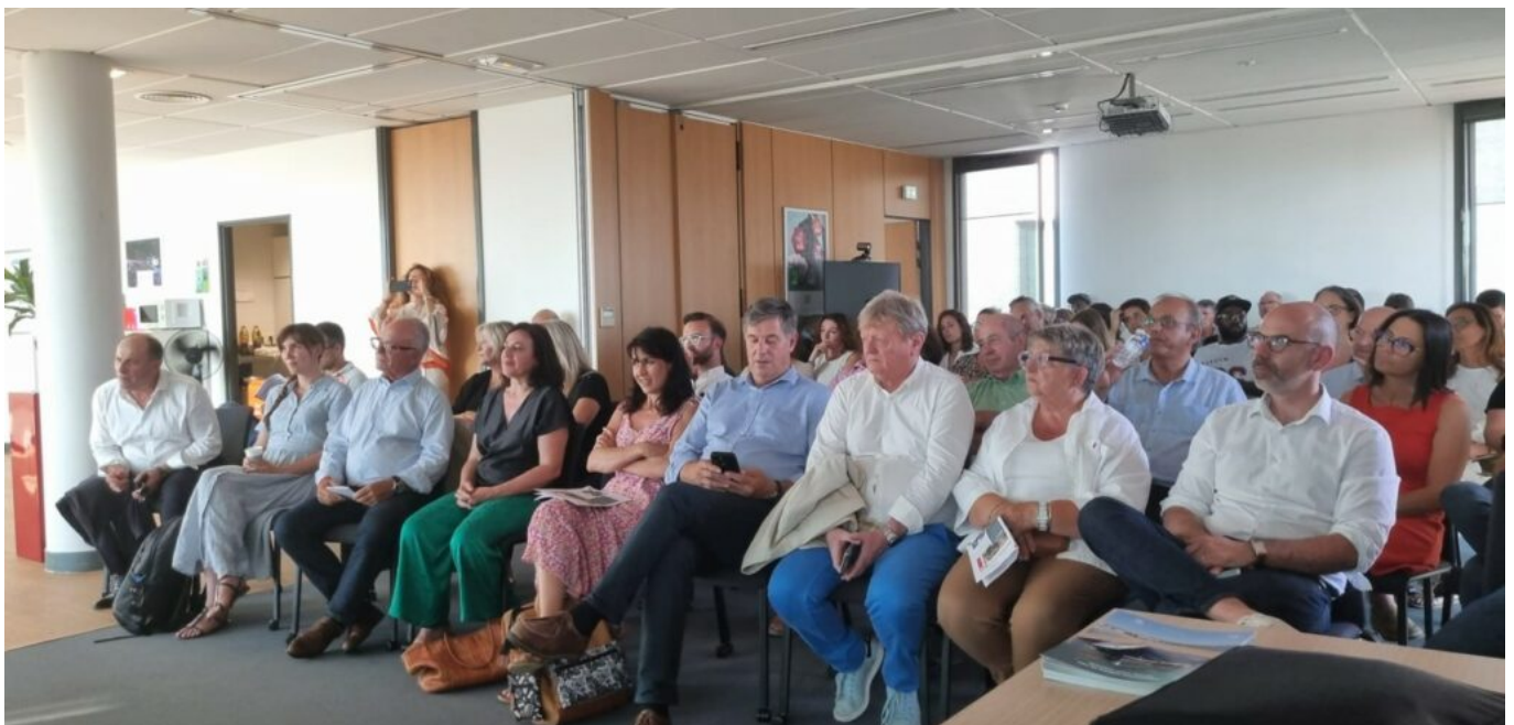
Une soixantaine de personnes ont participé à la première AG du GEIQ Auto Camion 2 Roues Sud.