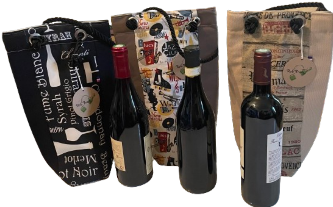
Rob'Fresh Up, sacs rafraîchisseurs d'inspiration marine