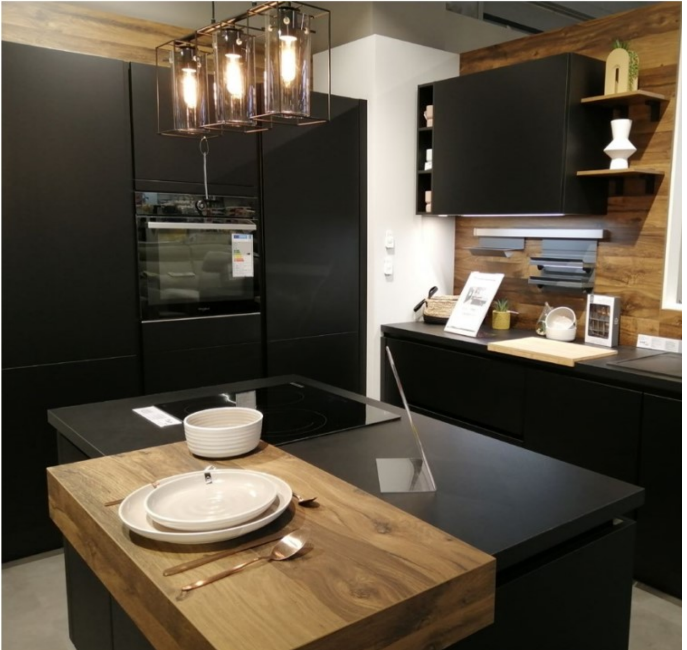
La cuisine selon But