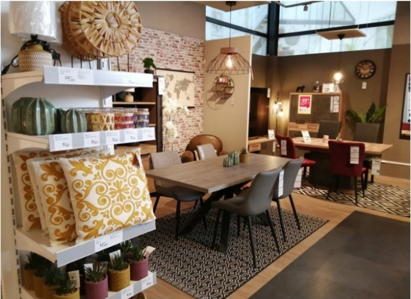
Salle à manger, les rayons font place aux corners déco