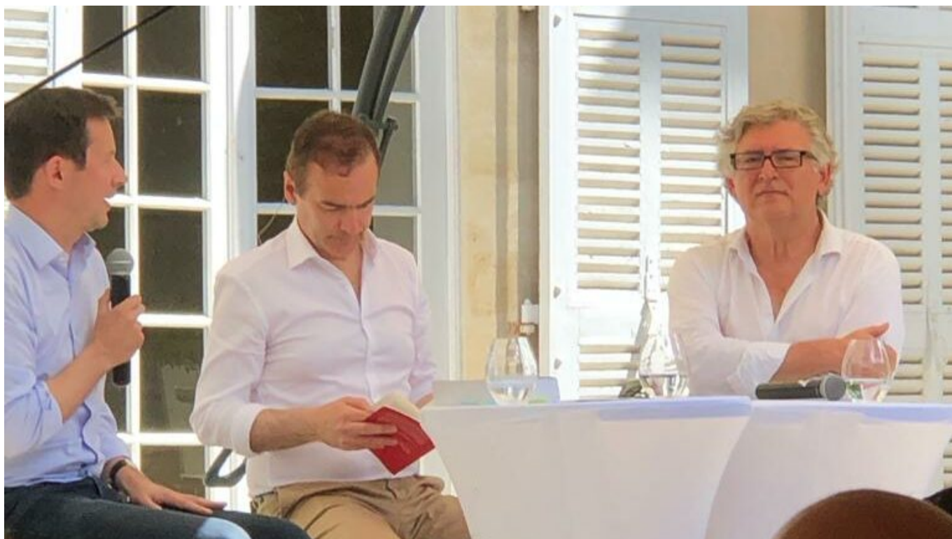
François-Xavier Bellamy, Franck Ferrand et Michel Onfray

Michel Onfray ajoute : « Le temps modifie l'enfant qui devient adulte, comme la graine qui devient plante. Au départ vous avez cette graine, elle explose et donne naissance à la tige qui grimpe, arrivent la feuille puis le bourgeon qui disparaît pour que naisse la fleur. L'enfant d'hier avec son idéal et ses blessures se dépasse lui-même, se détruit et devient l'adulte d'aujourd'hui ». Interrogé sur l'accélération du temps par Franck Ferrand, il précise : « Nous passons du liquide amniotique dans le ventre de notre maman à la vraie vie, de 4 pattes à bipède, nous avons un langage, bref, nous évoluons. Mais le futur n'est pas forcément mieux que le passé. »