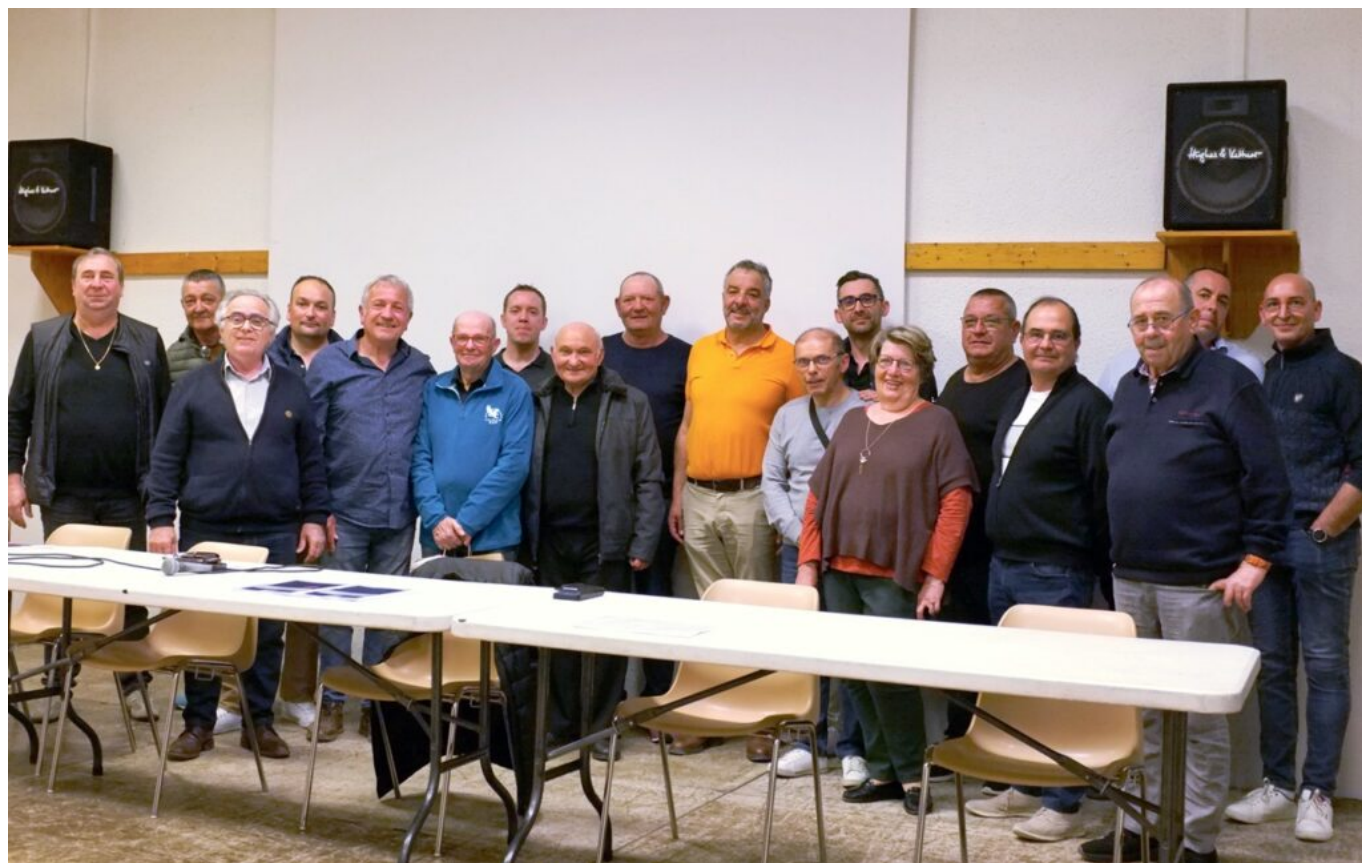
L'ensemble des membres du conseil d'administration de la Foire de Cavaillon.

corso ou la fête du melon. Les visiteurs aiment s'y retrouver chaque année et très souvent en famille. C'est une tradition.