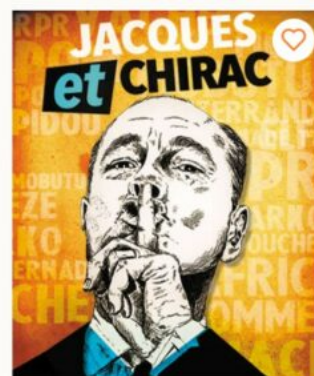
Jacques et Chirac