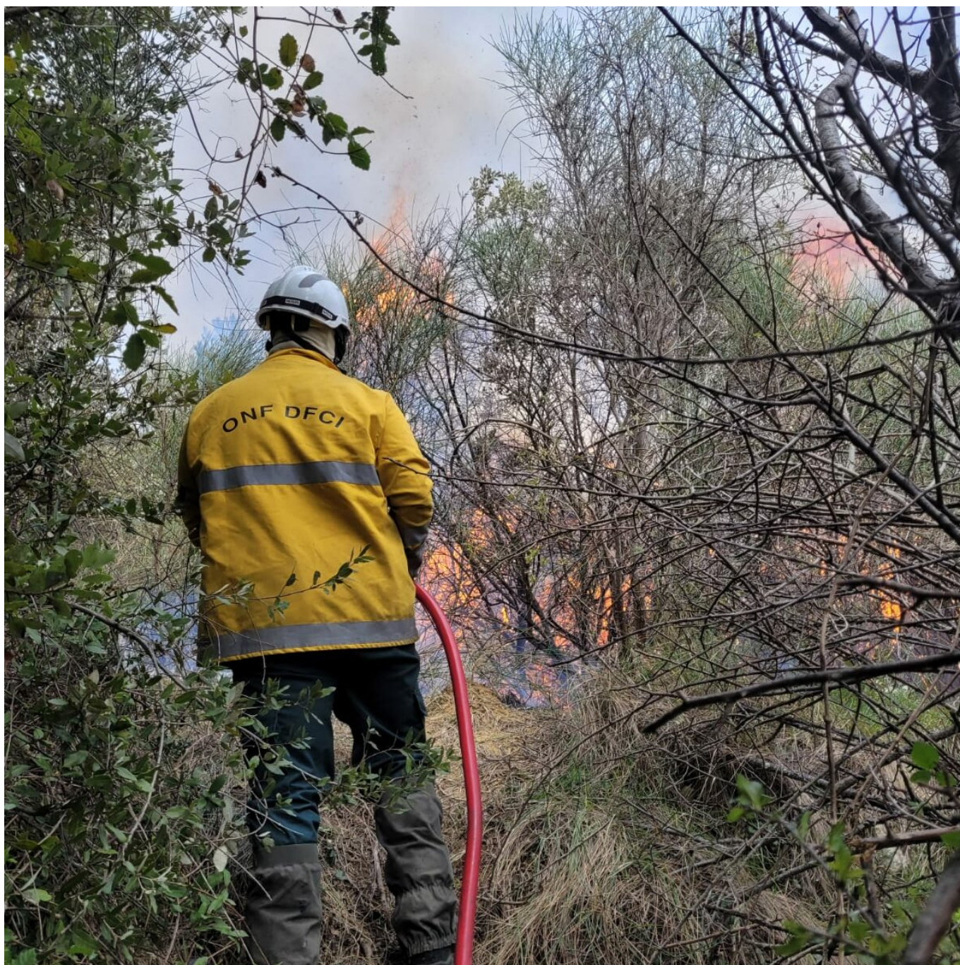
Intervention d'une patrouille

Au terme de cet été 2024, le bilan dressé par Pierre Augier, commandant adjoint chef de groupement opérations , est plutôt positif. Avec 13 départs les feux de forêt ont été moins nombreux qu'en 2023 et n'ont détruit que 4 hectares. Par contre avec 460 départs les feux de broussailles sont en augmentation de 30 % et ont détruits 20 hectares. (Bilan arrêté au 05.09.24).