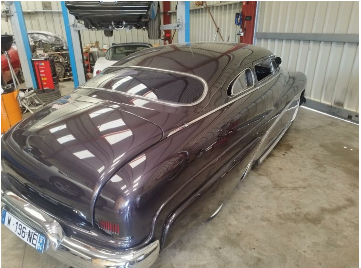
Une Mercury 1951 en réparation.