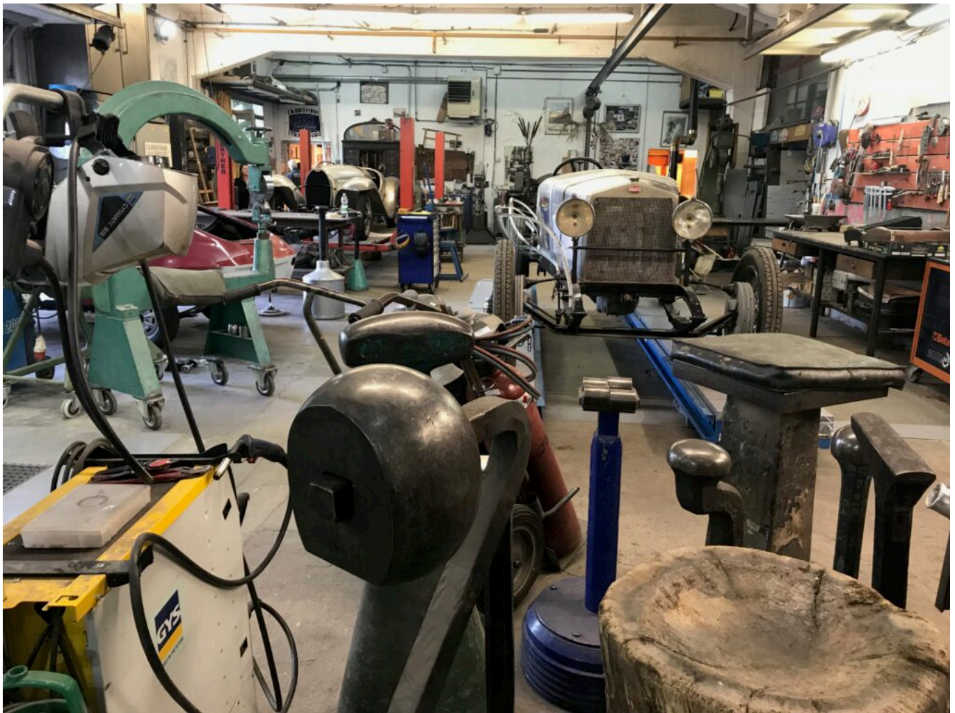
un atelier de restauration

du coin. La confiance est aussi un facteur important. Son « petit » garagiste c'est celui qui cherche à réparer plutôt qu'à changer, ou à ne remplacer que ce qui est nécessaire. Ces petites entreprises, qui sont les plus nombreuses, sont aussi les plus fragiles : forte pression concurrentielle, surcoûts énergétiques, problèmes de main d'œuvre, nécessité d'investir en permanence... Mais certains se battent pour continuer à exister, comme à Lourmarin où un jeune couple a repris un garage en se spécialisant dans les voitures anciennes ou de sport.