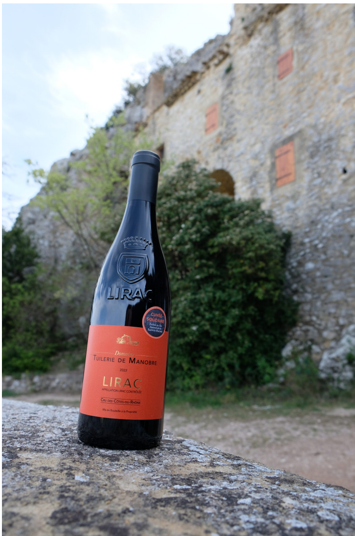
La cuvée solidaire, posée devant la Sainte-Baume.