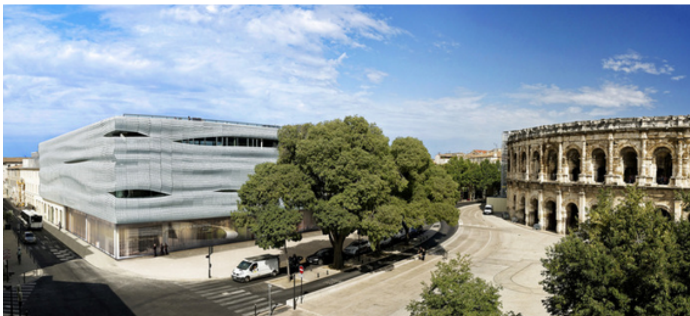
Musée de la Romanité

Mais le Gard est aussi l'héritier d'un patrimoine hors du commun avec plus de 500 Monuments historiques classés, dont le Pont du Gard et l'abbatiale de Saint-Gilles inscrits au patrimoine mondial de l'Unesco. C'est un territoire rempli de villes et villages de caractère qui ne laisseront personne indifférent tant l'atmosphère et l'architecture y sont uniques. On pense bien évidemment à Nîmes, Uzès ou encore Beaucaire mais le département regorge de pépites qui ne demandent qu'à être découvertes !