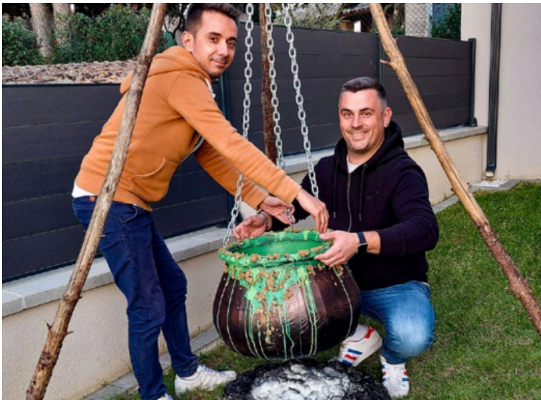
Les Ludovic en pleine préparation des décors.

Si les Américains sont les champions d'Halloween en termes de déguisements et de décorations, le Manoir de Comps n'a rien à leur envier. Cette année, le public pourra y admirer des décorations sur-mesure et animées faites avec des objets de seconde-main récupérés en brocante ou sur des sites de revente. Araignées géantes, chaudrons magiques et squelettes seront de mise.