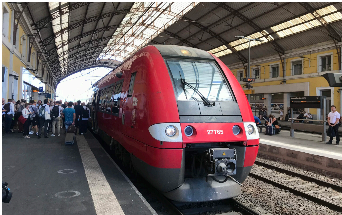
Le TER Lio d'Occitanie lors des essais et de la présentation en gare-centre d'Avignon.

« Je me suis toujours battue pour le train, insiste Carole Delga , présidente du Conseil régional d'Occitanie. Pour les trains à grande vitesse, qui désenclavent nos territoires et pour les trains du quotidien qui facilitent la vie. »