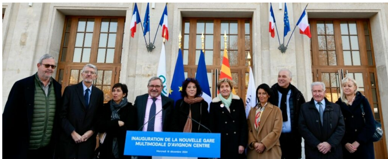
Les élus lors de l'inauguration.

« Il était important que nous nous mettions tous d'accord sur l'ambition que nous souhaitons donner à ce projet, confirme la maire d'Avignon. Notamment par l'ambition de connexion des différents modes de transport en repositionnant le train au cœur du dispositif. Car notre conviction, c'est que le train est une solution alternative au transport du quotidien pour les habitants d'Avignon, mais bien au-delà, pour les habitants du bassin de vie. »