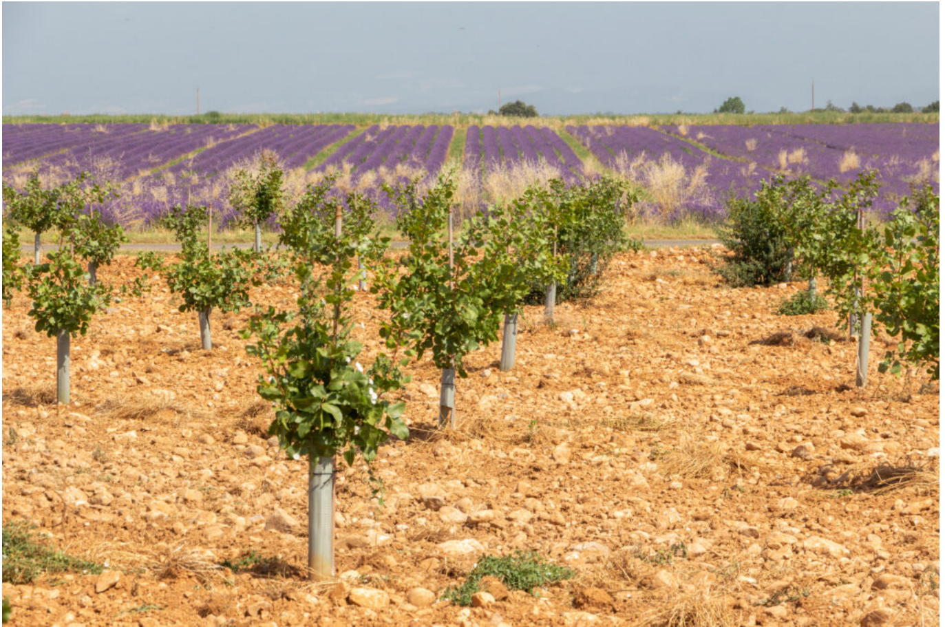
Plantation de 4 ans KERMAN - Alpes de Haute Provence