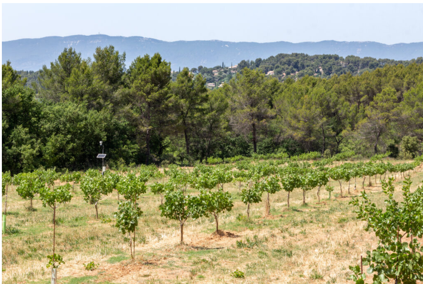
Plantations de 5 ans PONTIKIS - Luberon

De surcroît, les pistachiers ne redoutent pas les fortes températures ou le manque d'eau, ils se plaisent sur de terres maigres et n'ont pas besoin de beaucoup d'entretien. Leur floraison assez tardives les met à l'abri des risques des dernières gelées printanières. S'il faut attendre 6 à 8 ans pour effectuer les premières récoltes après plantation le pistachier est un arbre qui vit très vieux. Certains spécimens, âgés de plusieurs centaines d'années, produisent toujours. Les similitudes avec l'olivier sont importantes. D'ailleurs les zones de productions sont identiques.